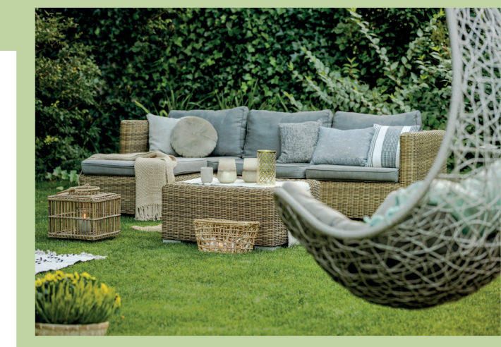
Beispiel für Gartenbereich