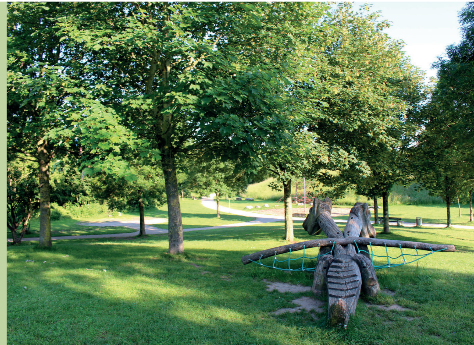
„Monte Scherbelino“ Naherholungsgebiet