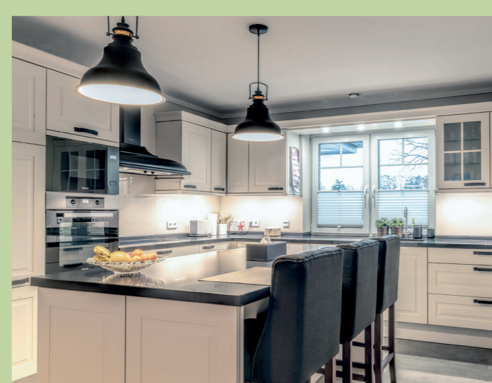
Beispiel für Wohn-Ambiente

Der Standort zeichnet sich vor allem durch seine abwechslungsreiche Umgebung aus. Nur einen Steinwurf entfernt von Ihrem neuen Zuhause lädt der „Monte Scherbelino“-Park und eine schnelle Verbindung in die Kernstadt zu Spaziergängen, Fahrradtouren und vielfältigen Freizeitaktivitäten ein.