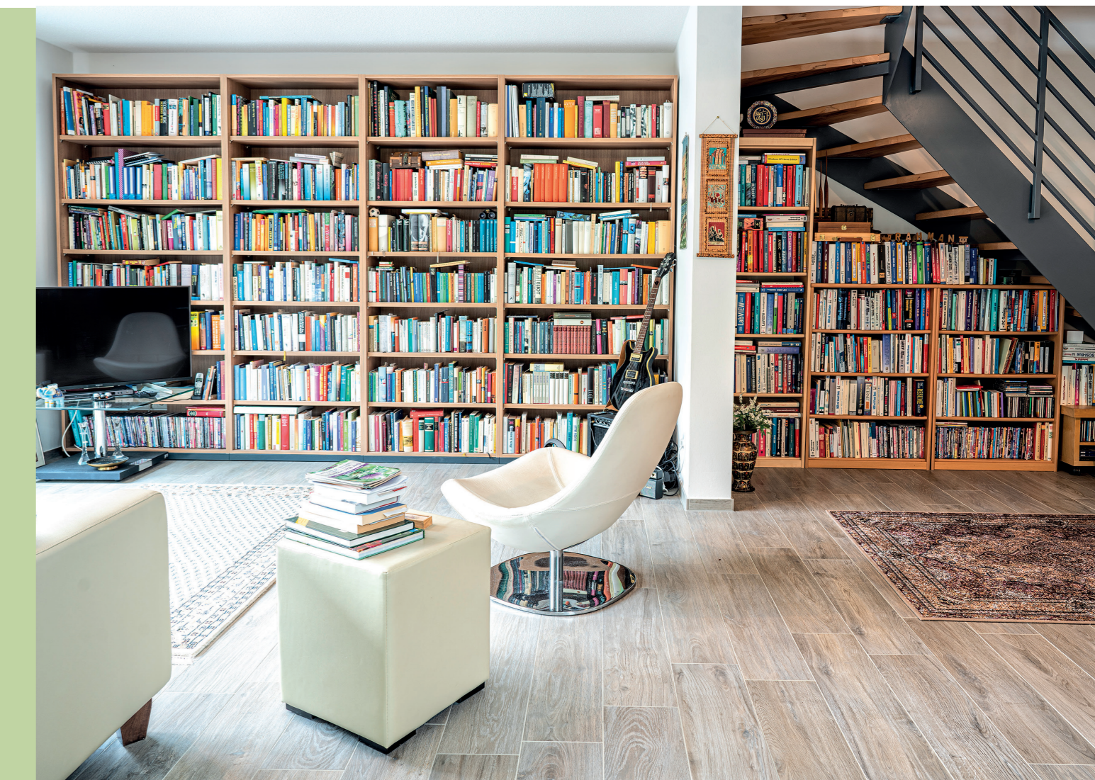
Beispiel für Wohn-Ambiente

4 X REIHENWEISE LEBENS-LUST AUF 130 QM WOHNFLÄCHE